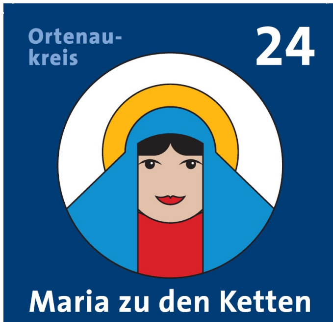
Maria zu den Ketten- Piktogramm Autor Landratsamt Ortenaukreis